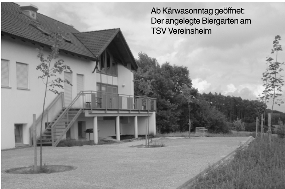
Ab Kärwasonntag geöffnet: Der angelegte Biergarten am TSV Vereinsheim

unterhalb des Vereinsheimes wird man sicherlich auch die schöne Aussicht in den Bibertgrund bei einem kühlem Radler oder einem Kaffee genießen können.